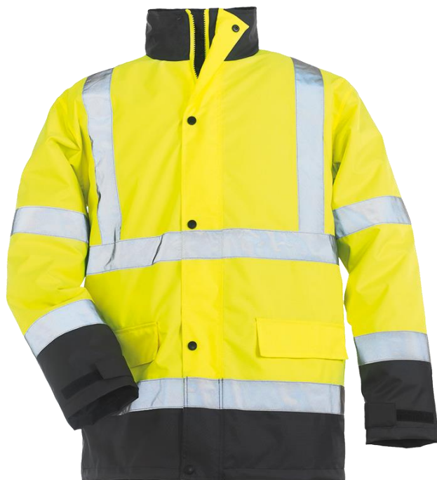
Jaune / Bleu