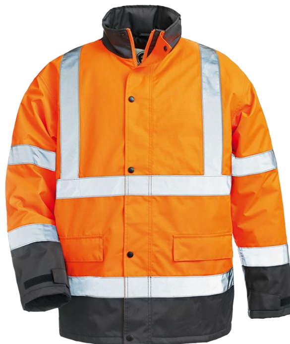
Orange / Bleu